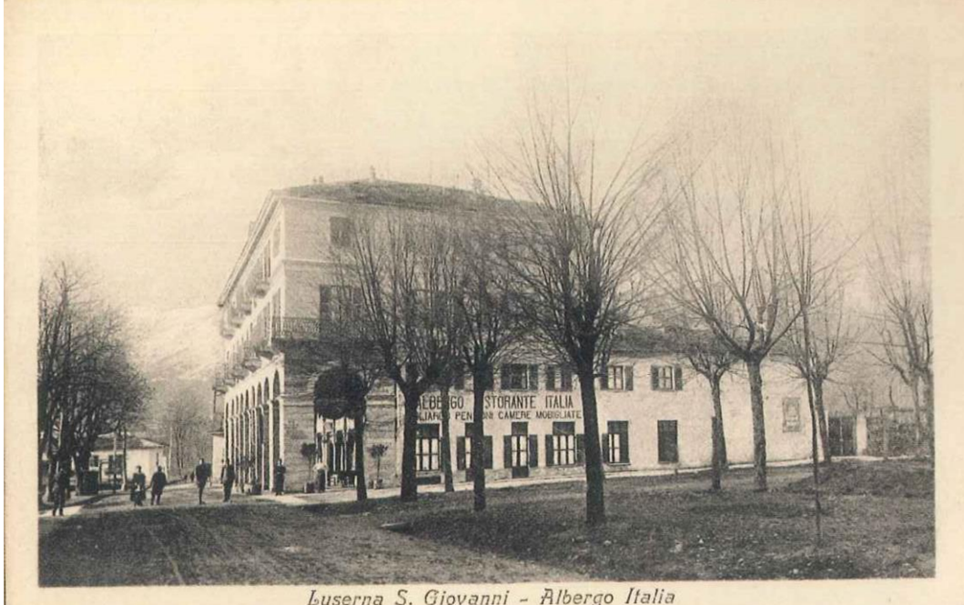
Luserna S. Giovanni - Albergo Italia

Il progetto generale della piazza prevedeva che fosse porticata su tra lati, questo non avvenne mai. Attualmente sono porticati solo due lati, mentre il terzo, verso il peso pubblico presenta fabbricati in cortina di varie epoche e volumetrie, come rappresentato negli elaborati grafici di progetto.