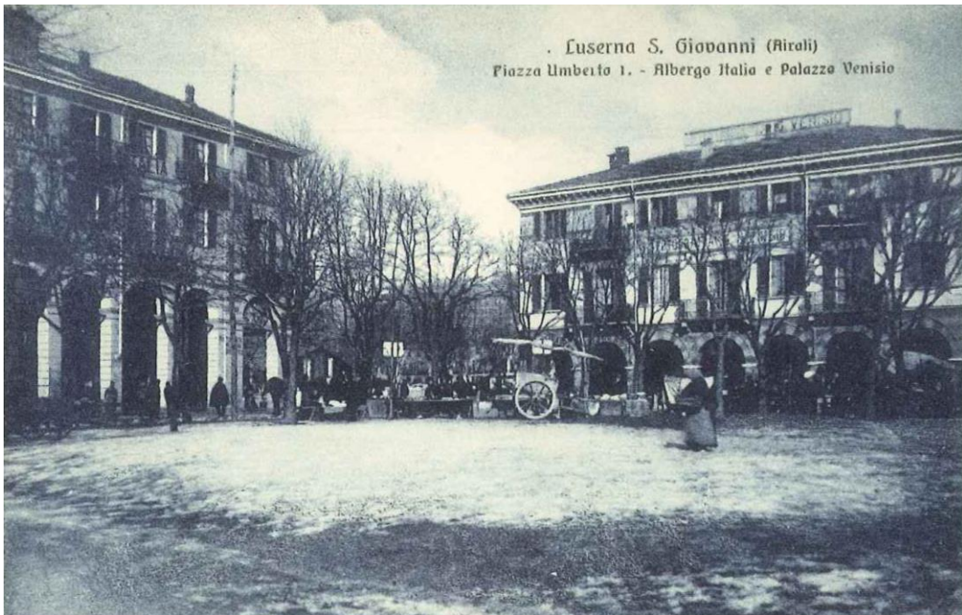
Luserna S. Giovanni (Airali) Piazza Umberto I. - Albergo Italia e Palazzo Venisio

La centralità di Airali è sempre stata comprovata da aspetti tipici della vita quotidiana quali: mercato, negozi, farmacia, l'ex albergo "Vittoria", nonché il Palazzo Comunale. Tuttavia molteplici per concause non è mai stato pensato uno spazio in cui il fulcro fosse la piazza stessa e l'utente che la vive.